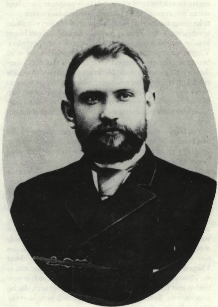
Portret van W.H. Vliegen, vermoedelijk daterend van de jaren 1885-1890.