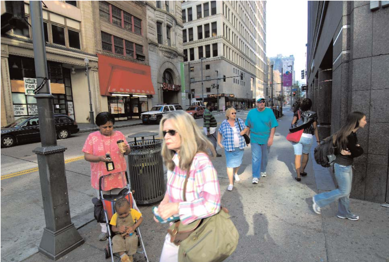
Pittsburgh heeft sedert 1960 bijna 300 000 inwoners verloren. Als gevolg daarvan hebben ook veel winkels, warenhuizen en bedrijven het centrum van de stad verlaten.