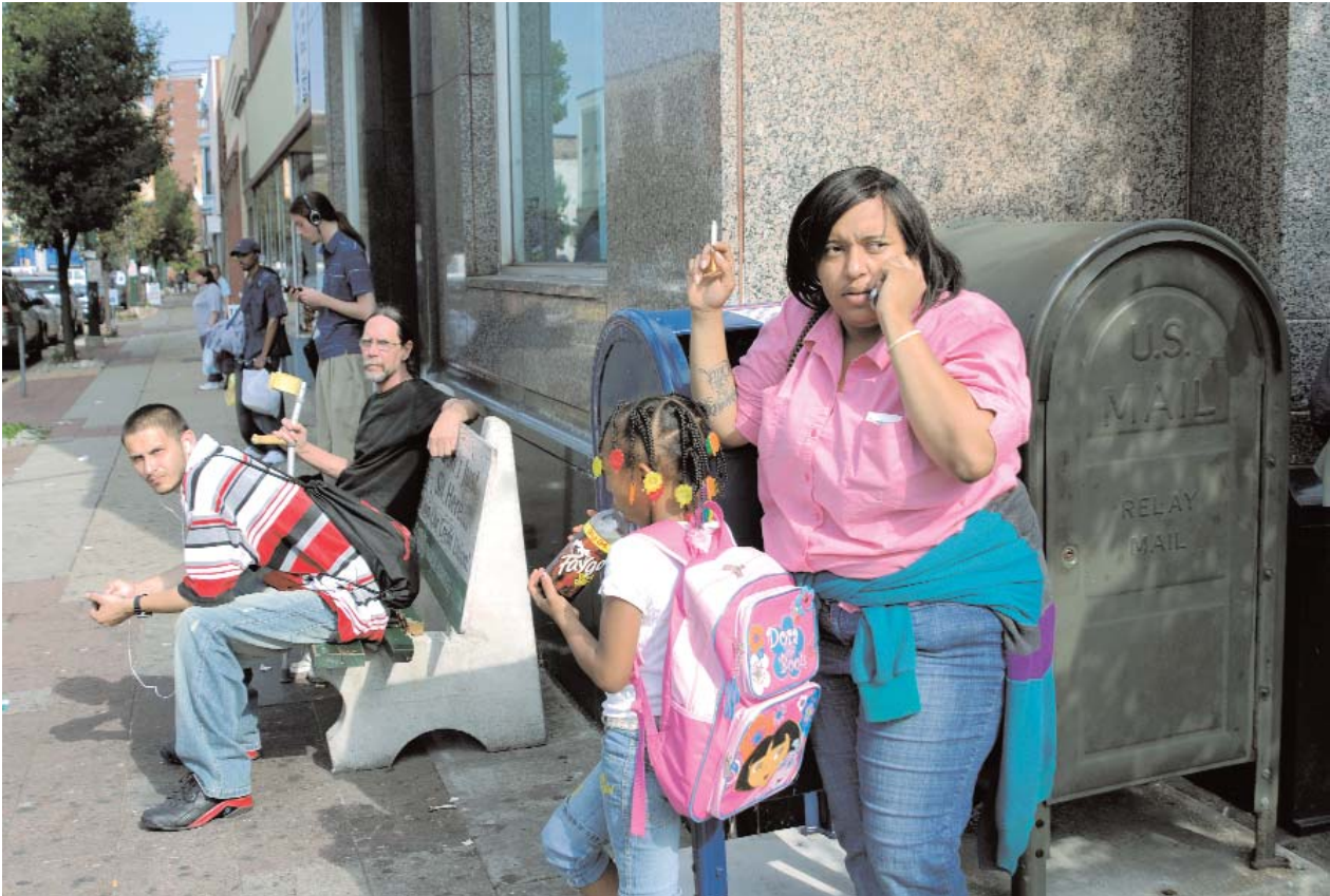
Homestead, een voorstad van Pittsburgh, was ooit de locatie van de grootste staalfabriek van de wereld. Nu is het een van de armste steden van Amerika.