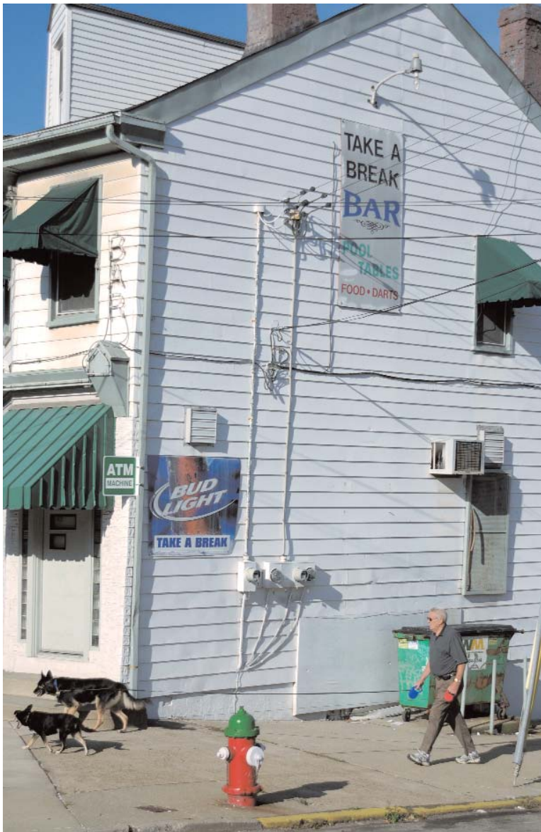
De Take A Break Bar in Lawrenceville, een arbeidersbuurt van Pittsburgh.