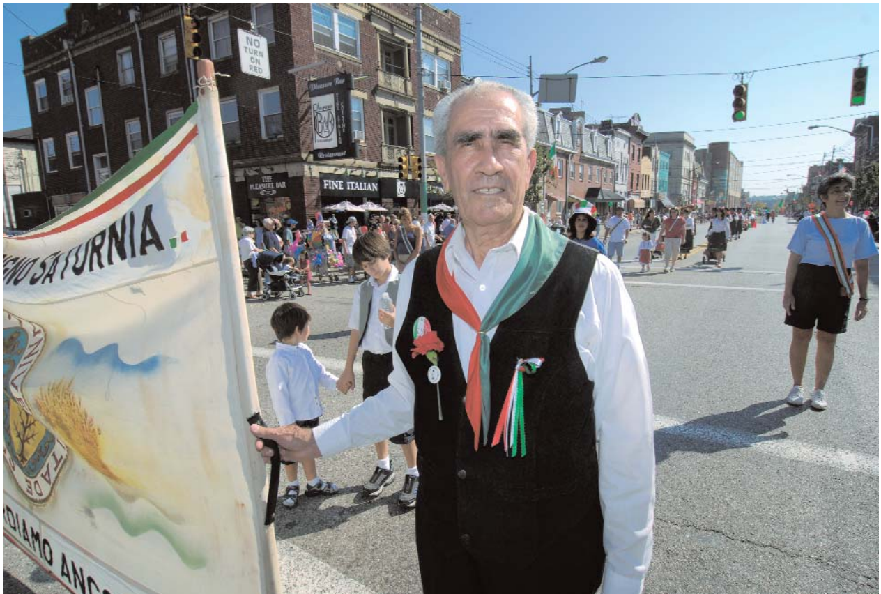
De bevolking van Pittsburgh is een lappendeken van etnische groepen. Deze man van Italiaanse afkomst viert Columbus Day in Bloomfield, de Italiaanse wijk.