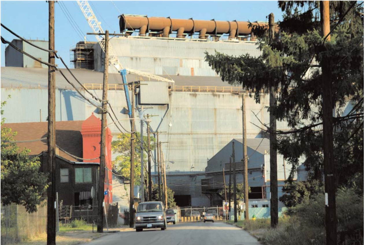
De Edgar Thomson Steel Works in Braddock, een voorstadje van Pittsburgh, dateert uit 1872. Het is de enige fabriek in de omgeving van Pittsburgh waar zo'n 900 arbeiders nog steeds staal produceren.