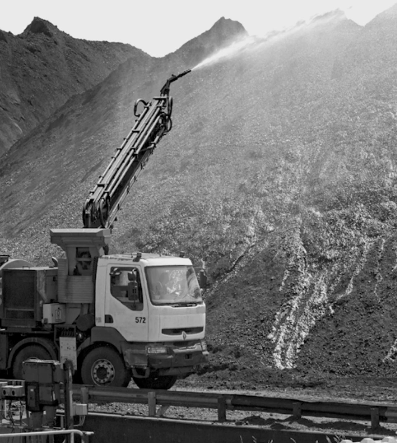
Velsen-Noord 2014: Op het fabrieksterrein van de staalfabriek Tata Steel houdt een vrachtwagenchauffeur de bergen ijzererts, koolstofen steenkolen nat.